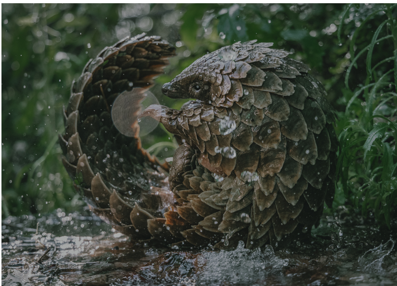
Pangolin: Kulu’s Journey

Tra gli ospiti più attesi c’è invece Pippa Ehrlich , premio Oscar per My Octopus Teacher , che sabato 1° agosto presenterà Pangolin: Kulu’s Journey e riceverà il Legacy Award del Festival per il contributo dato al cinema naturalistico.