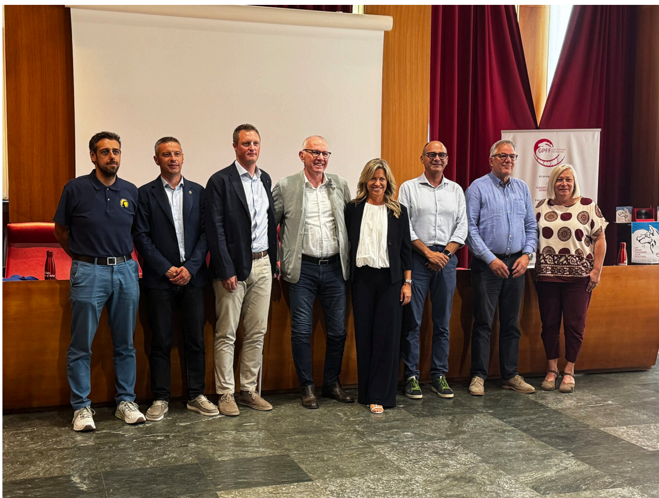
Conferenza stampa Gran Paradiso Film Festival

Il Festival conferma così la sua dimensione internazionale – "è il terzo festival di cinema wildlife più longevo al mondo", ricorda Vuillermoz – senza perdere il legame con il territorio che lo ospita.